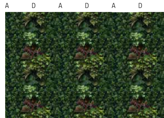
A D A D A D