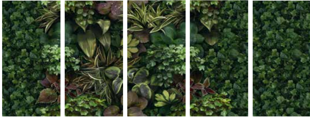
4100151 JANE A 4100152 JANE B 4100153 JANE C 4100154 JANE D 4100155 JANE E