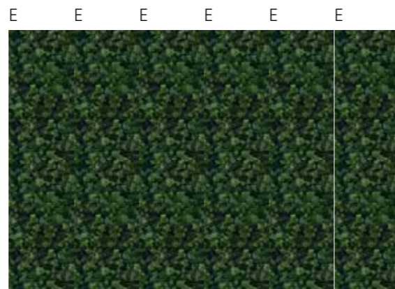
E E E E E E