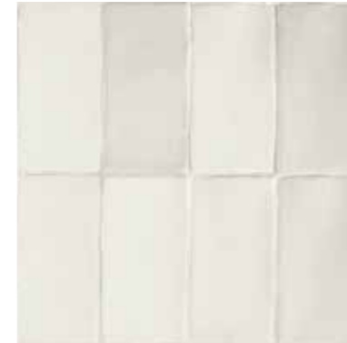
4100366 MATTE BIANCO