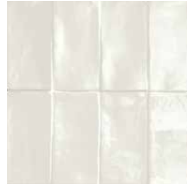
4100363 LUX BIANCO