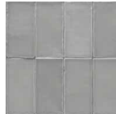
4100367 MATTE GRIGIO