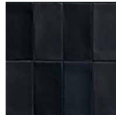
4100368 MATTE NERO