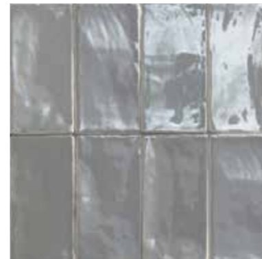
4100364 LUX GRIGIO