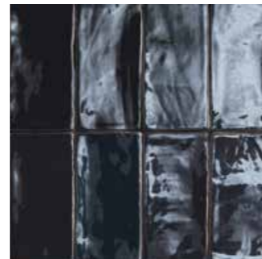
4100365 LUX NERO