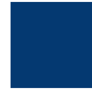
28 OCEAN 4100826