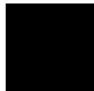
25 BLACK 4100823