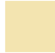
17 VANILLA 4100815