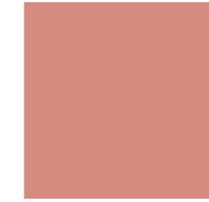
08 STRAWBERRY 4100806