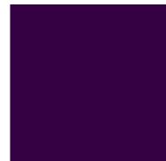
05 PURPLE 4100803