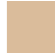
19 NUT 4100817