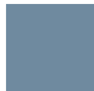
31 CERULEAN 4100829