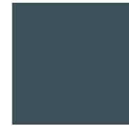
27 NOTTE 4100825