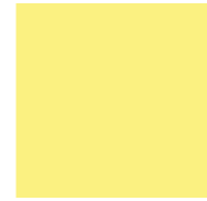
16 LEMON 4100814