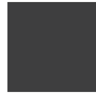
26 ANTRAX 4100824