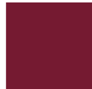
04 BORDEAUX 4100802