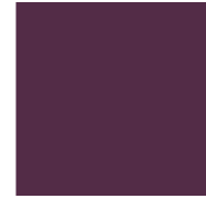
06 VIOLET 4100804