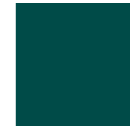
39 PEACOCK 4100837