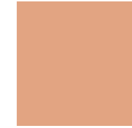
10 NUDE 4100808