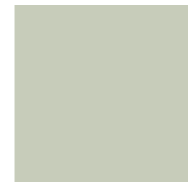
36 SALVIA 4100834