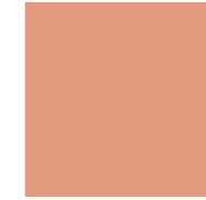
09 BLUSH 4100807