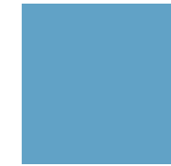
30 POOL 4100828