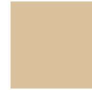
18 SAND 4100816