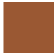
13 TOBACCO 4100811